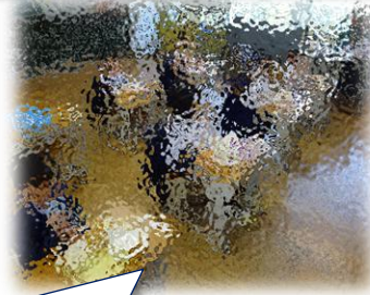
はじめての給食(1年生)